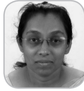
ദൈവത്തിനു മുൻപണമകൊടുക്കുക സാലി മോനായി