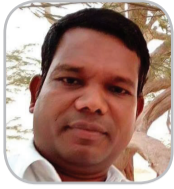
ഇപ്പോഴത്തെ ട്രസ്റ്റ് സന്തോഷ് പന്തളം